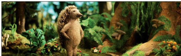
LA MAISON DU HÉRISSEON

Un toup'tit programme qui répondra à toutes ces grandes questions.