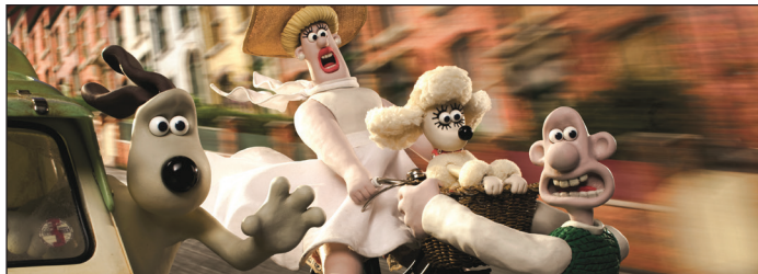
UN SACRÉ PÉTRIN

Vous les connaissiez inventeurs? Les voici entrepreneurs! Nettoyeurs de vitres ou boulangers, Wallace et Gromit mettent du cœur à l'ouvrage. Un peu trop peut-être... Dans Rasé de près (première apparition de Shaun le mouton) comme dans Un sacré pétrin (inédit au cinéma), l'amour aveugle de Wallace va précipiter le duo dans de folles aventures aux allures de polar !