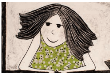
La petite pousse

Les courts métrages internationaux en lice dans la catégorie «Jeune Public» ont été choisis parmi les différentes compétitions de l'édition 2015, à savoir parmi la Compétition internationale (prog. 1, prog. 2, prog 4, prog. 6), la Compétition suisse (prog. 1), la Compétition internationale Labo et la Compétition internationale Docanim's.