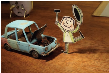
Le pêcheur Marsicek

Qui aura la plus belle des voitures ? Qui réussira à être le plus malin ? À vos marques... prêts... partez !