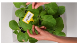
ILLUSTRATION : COMPOSTAGE | Elise Auffray | France | 2014 | 2'35''

Deux amis, une chenille et un têtard, grandissent dans deux environnements différents.